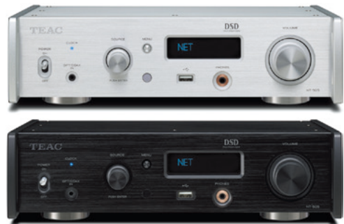
DSD Direct Stream Digital シルバー(S) ブラック(B)