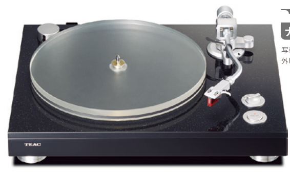
ナイフエッジ 写真はダストカバーを外した状態です。 ブラック(B)