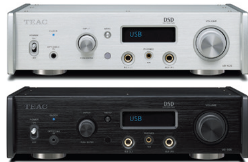
DSD Direct Stream Digital シルバー(S) ブラック(B)