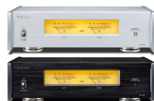
シルバー(S) ブラック(B)

XLRバランス出力を搭載した本格派ベルトドライブ・ターンテーブル 異素材を組み合わせたハイブリッドシャーシに、ナイフエッジベアリング採用の9インチS字ユニバーサルアームやPRS3回転数自動調整機構を備えたMCバランス出力対応のターンテーブルです。Ortofon社製MMカートリッジ2M RED装着済み。 ●形式:ベルトドライブ ●回転数:33-1/3、45、78rpm ●ウフラッター:0.1%以下 ●付属カートリッジ:MM型(Ortofon社製2M RED) ●出力:XLR×1、RCA×1(いずれもモノ出力のみ) ●消費電力:2W ●外形寸法:450(W)×148(H)×351(D)mm ●質量:約10.5kg 本機はフォノアンプを内蔵していないため、別途フォノアンプ、またはフォノ入力付きアンプが必要です。