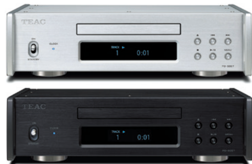
シルバー(S) ブラック(B)