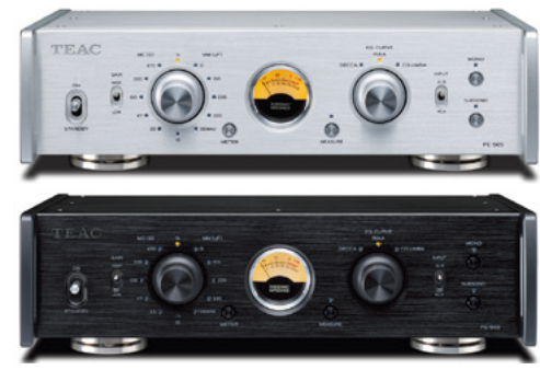
シルバー(S) ブラック(B)