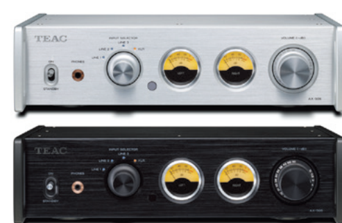
シルバー(S) ブラック(B)

デュアルモノラル、完全バランス出力回路構成のフォノアンプ 高精度のRIIA補正回路の他、DECCA、COLUMBIAの各EQカーブにも対応。また、MCカートリッジの負荷抵抗に加え、MMカートリッジの負荷容量切り替えも備えており、レコードやカートリッジに合わせたセッティングが可能です。 ●THD:0.002%*1 0.02%*2 ●残留雑音電圧:10μV*1 85μV*2 ●S/N比:106dB*1 86dB*2(定格入力) ●RIIA偏差(20~20kHz):±0.05dB ●チャンネルセパレーション:-90dB以上(MM、10kHz、GAIN LOW) ●入力:XLR/バランス各×1、RCAアンバランス各×1 ●消費電力:14W ●外形寸法:290(W)×84.5(H)×252.2(D)mm ●質量:4.5kg *1MM入力(RCA) *2MC入力(XLR)